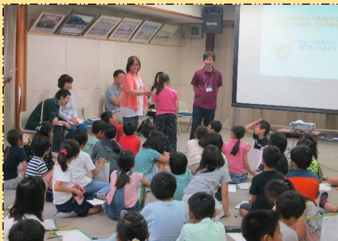
〔認知症サポーター養成講座〕