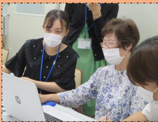
〔Zoom ボランティア が教える Zoom 講座〕