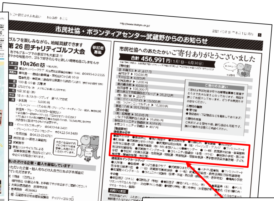
※市民社協広報紙「ふれあい」2021年8月号3面に掲載されたものです