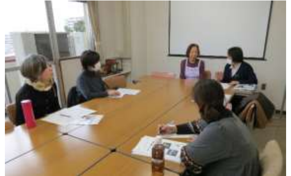
実際に活動されている方のお話に興味津々です！

3月11日（金）施設ボランティアコーディネーター（施設や団体でボランティアの受入れをしている担当者の方々）を対象とした懇談会を実施し、西東京市にある高齢者施設「緑寿園」を訪問しました。緑寿園では10年以上活動が続いているボランティアさんが多く、「ボランティアに愛される秘訣」について伺いました。