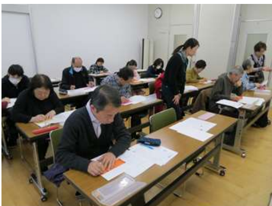
手が痛くなるくらい夢中で取り組みました

VCMではボランティア団体と協働して様々なテーマで講座を開催しています。今年度は視覚障害者を支えるボランティア「点訳」をテーマに開催しました。私達が普段何気なく目にする点字は、この点訳を行うボランティアによって支えられています。