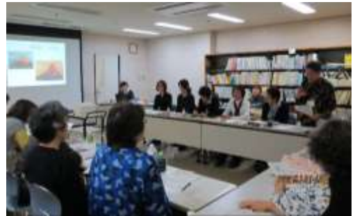
板橋会話パートナーズの会との交流会

伝えたいことがなかなか伝わらないもどかしさがあります。それは失語症の皆さんも同じだと思います。しかしそれだからこそ「そうそう、そうなの」と理解し合えた時は、一層大きな喜びとなります。そして一緒にゲームをしたり、時には外出をしたりして楽しい時を過ごしています。武蔵野市では現在も会話パートナー養成講座が行われています。一人でも多くの方がこの活動に参加して下さることを願っています。