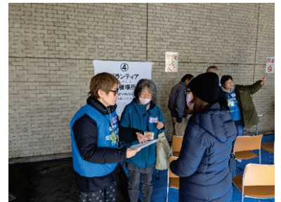
ボランティア活動先が決まるとスタッフから活動についての説明を行います。