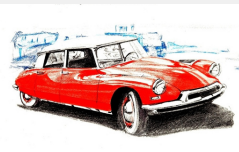
内藤さんのイラスト

そうやって作られたVCM通信が今日も広報誌を手にとってくださった方の「ボランティアをやってみよう」の気持ちを後押ししていることと思います。