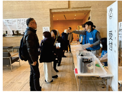
受付ではボランティア登録フォームの入力確認とボランティア保険の加入チェックを行います。

今年の訓練では初めての取り組みとして、ボランティア役の方に【受付フォームによるボランティアの事前登録】をしていただき、実際の発災時に近いボランティア登録場面をシミュレーションすることができました。また、活動後のボランティアさんによる活動報告(活動目的の達成度合い、活動場所や道路の状況、次回活動する際に追加で必要な物品の有無等)の場面を想定した訓練も実施しました。ご参加・ご協力いただいたみなさま、ありがとうございました。